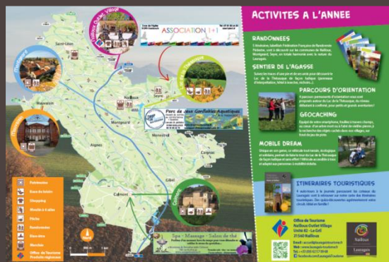
Set de table

En devenant partenaire, vous bénéficiez de services indispensables pour améliorer votre communication, renforcer votre offre et stimuler votre chiffre d'affaires.