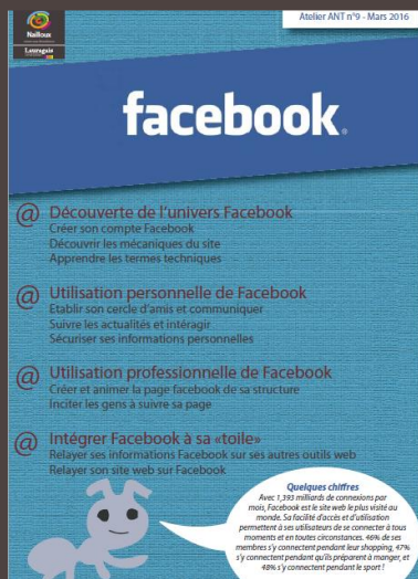
Programme d'un atelier numérique